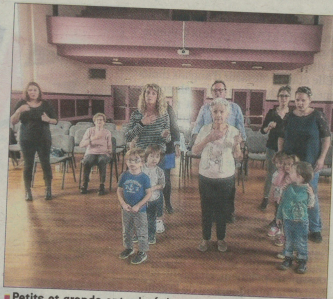
■ Petits et grands ont mimé des pirogues.