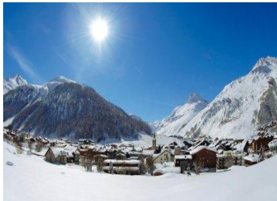
Table d'hôtes Avril 2018