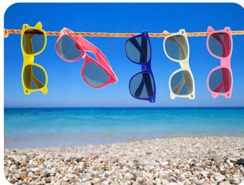
Table d'hôtes Juin 2018