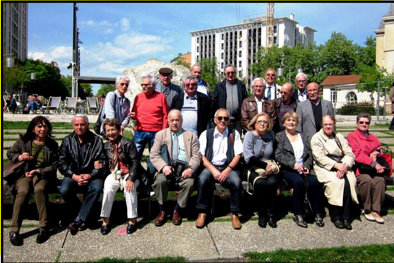
Le Petit Gadin