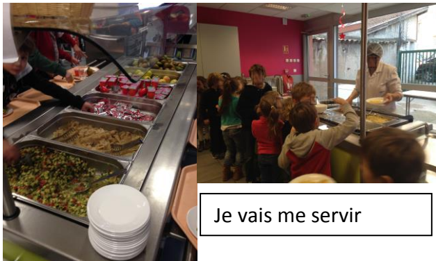
Je vais me servir