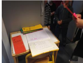
Je suis accueilli à l'entrée du self