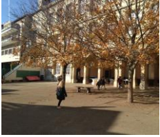
11h30 Je suis dans la cour