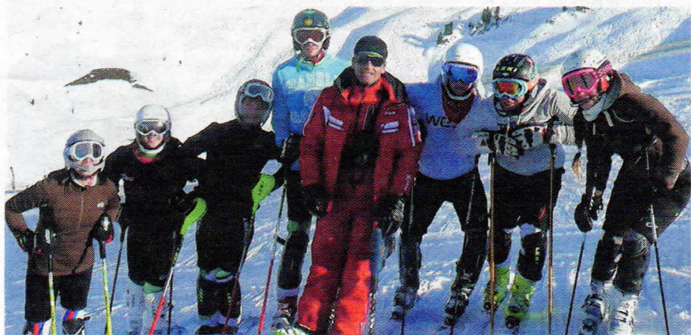
■ Le plaisir ludique d'être ensemble n'empêche pas d'améliorer sa technique de ski.

Depuis 65 ans et sa création en 1947, le Club ski laïque lyonnais (CS2L) offre la possibilité aux citadins de tous âges de profiter des joies du ski.