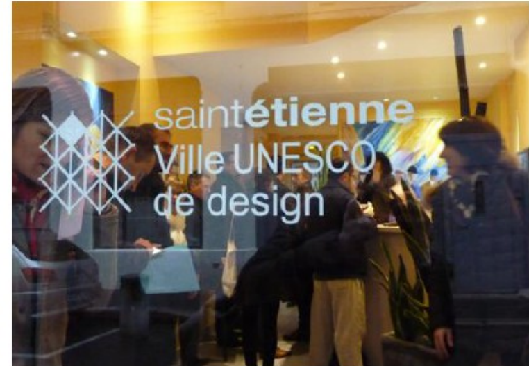
■ Ces décorations adhésives constituent « une identité visuelle simple et permanente ».